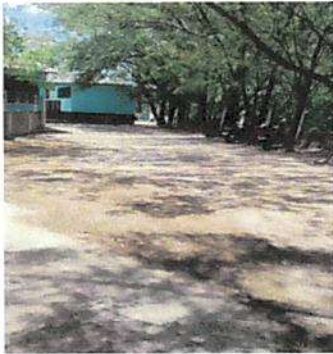
Foto1: Sustitucion de piso de tierra por piso de cemento